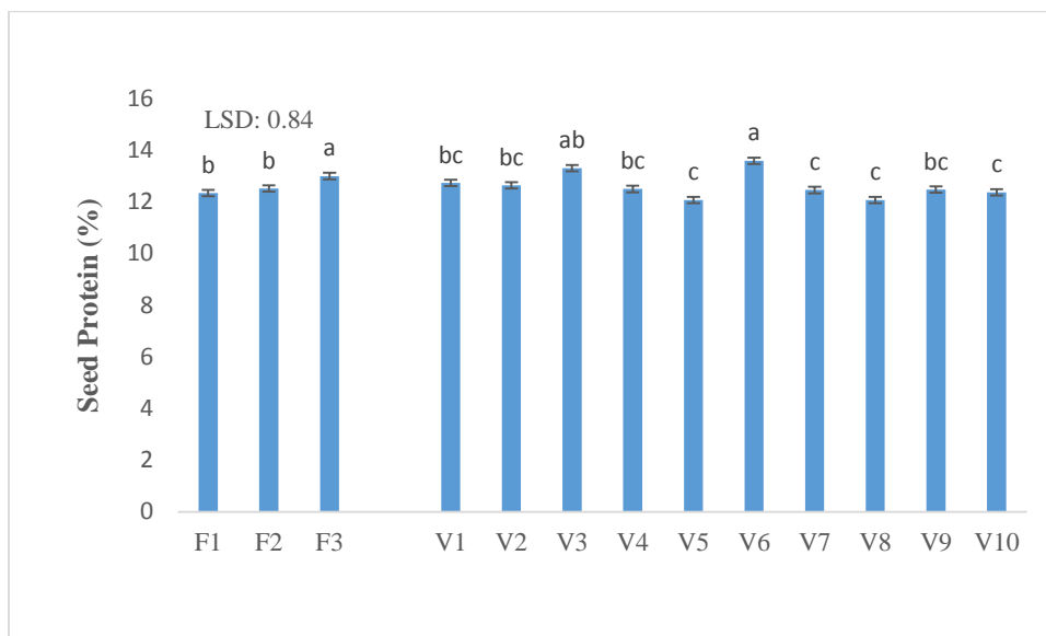
شکل ۱- اثر منابع تأمین نیتروژن بر مقدار پروتئین دانه ارقام گندم